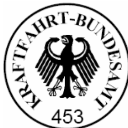
(A. von Höveling)